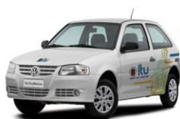
Layout Veículo Pequeno Hatch