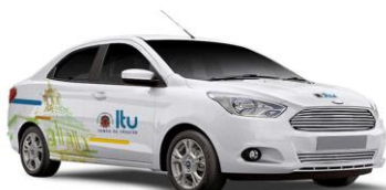
Layout Veículo Médio Sedan