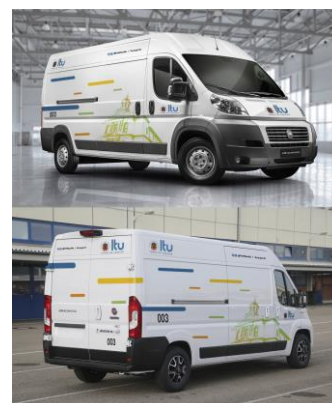
Layout Veículo Grande Vans