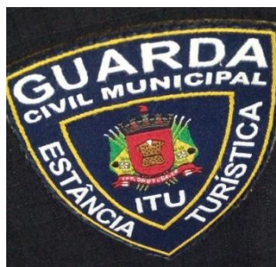
Imagem da logomarca da GCM

Logomarca para padronização: na lateral externa do cano deverá possuir uma etiqueta de identificação/padronização composta por borracha, inserida através de costura sob a canaleta de blaqueação constante na peça, conforme imagem abaixo, este deverá ter 4,5cm de altura x 4,0cm de largura.