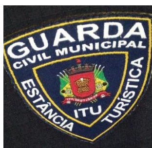
Imagem da logomarca da GCM

2.1.3. CONTRA FORTE INTERNO E BIQUEIRA; material termoplástico, conformado termicamente, resistente, revestido/reforçada em poliéster, absorvente, com as seguintes especificações: