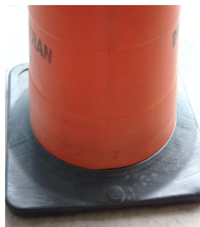
Base do cone