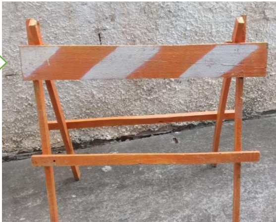
Cavalete atual frente