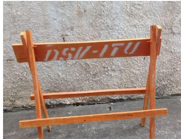
Cavalete atual verso