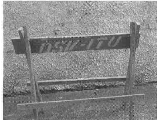
Cavalete atual verso