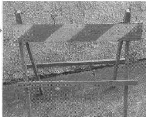
Cavalete atual frente